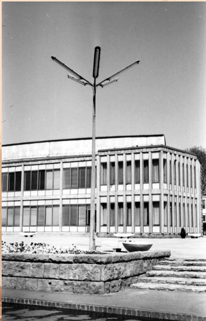
Közvilágítási oszlop a Művelődési- és Sportház előtt, 1966. 06. 01.