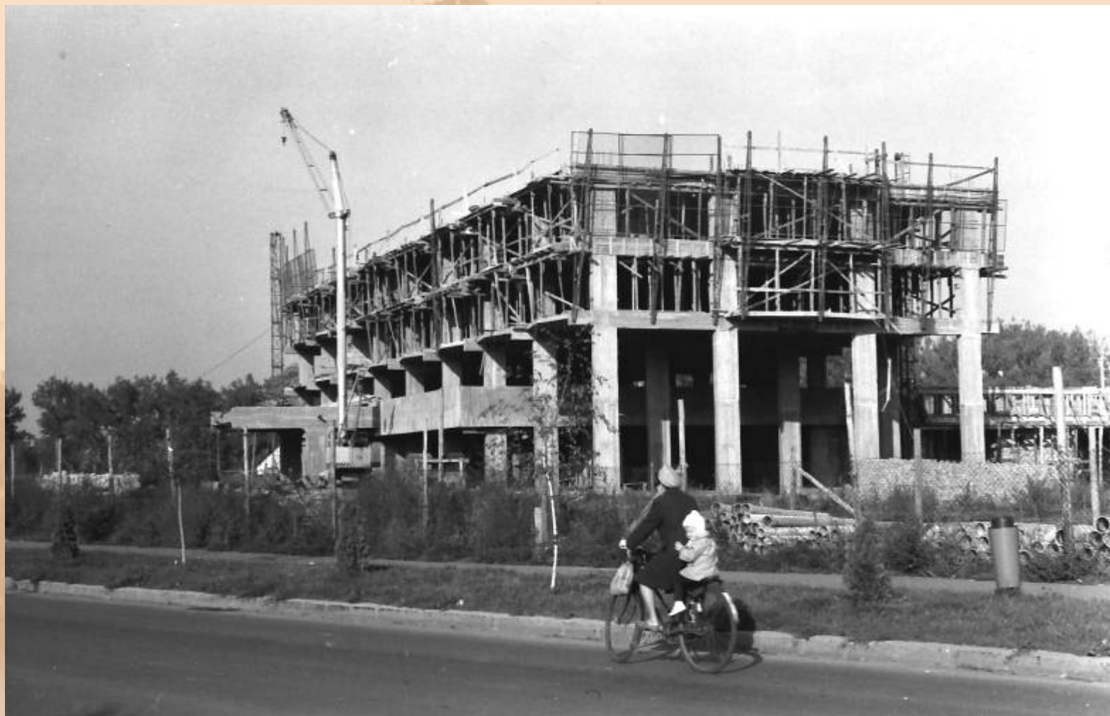
A Claudius Szálló, 1970. 10. 17.