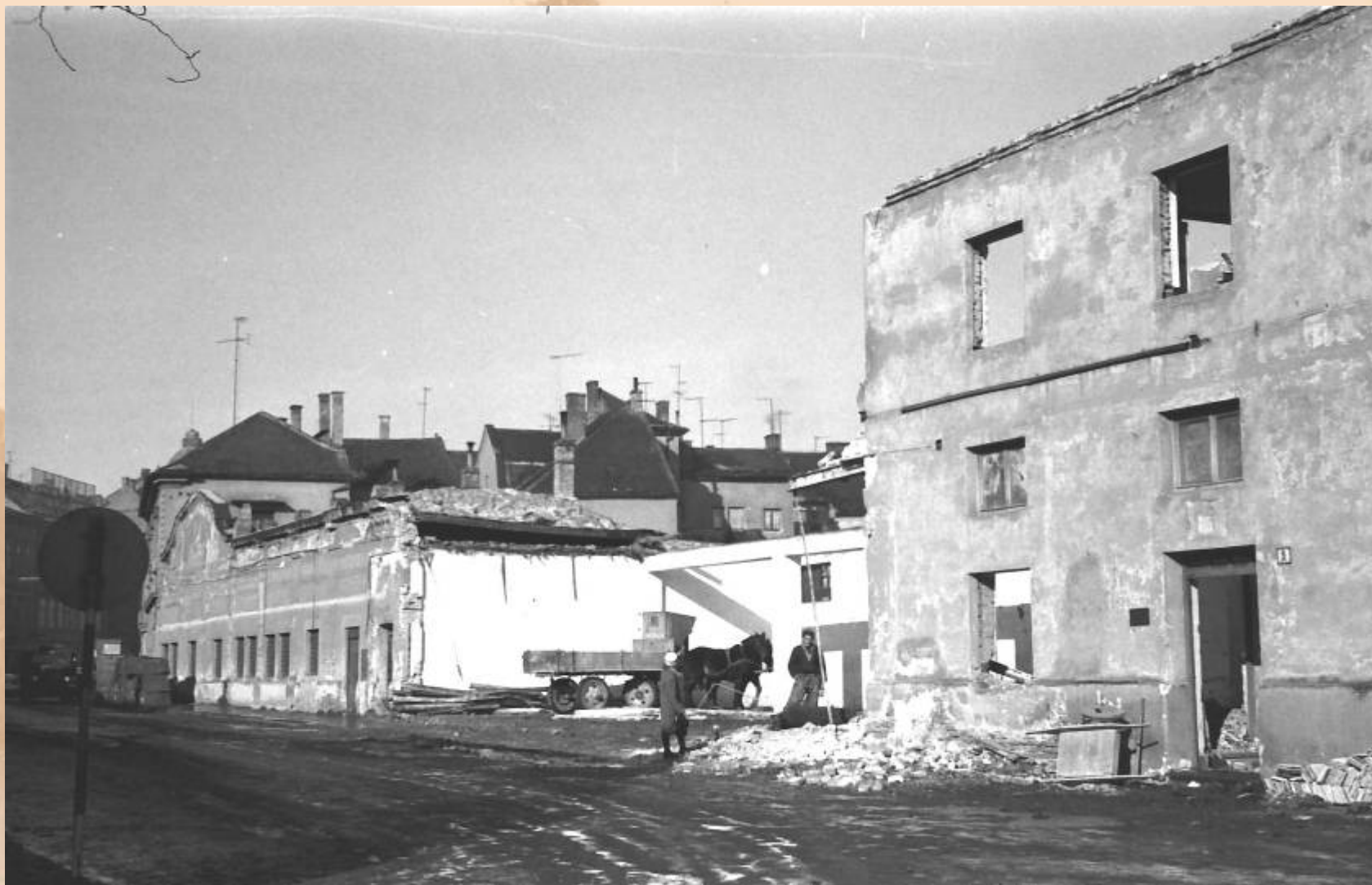
A Bejczy István utca 1., 3., 5. sz. házak, 1968. 01. 17.