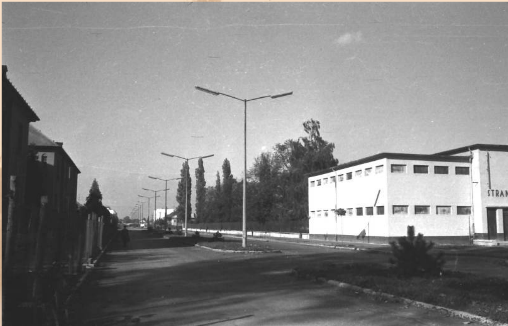
Közvilágítási oszlop a Markusovszky Lajos utcában, 1966. 10. 19.