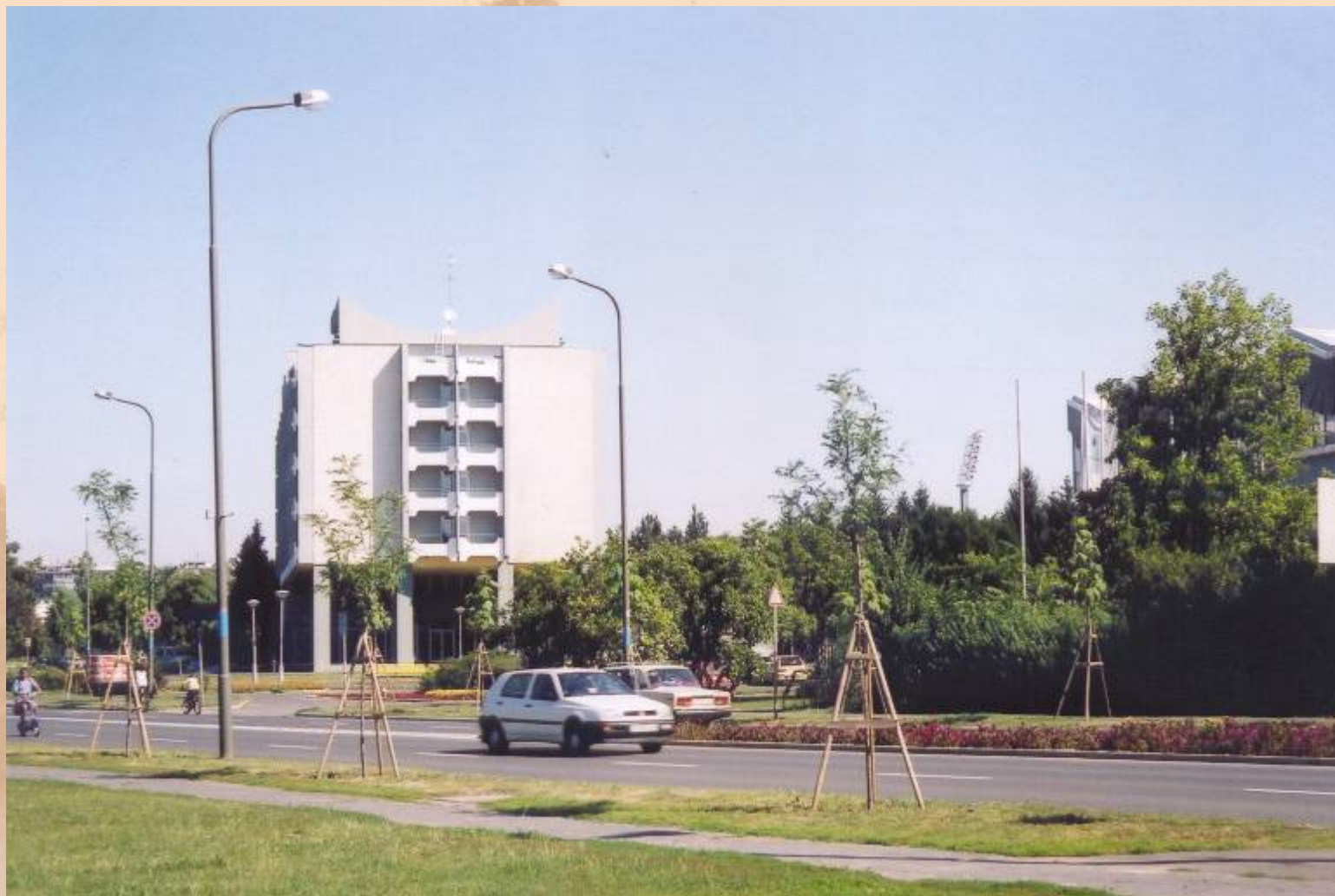
A Claudius Szálló, 2004. 08. 23.