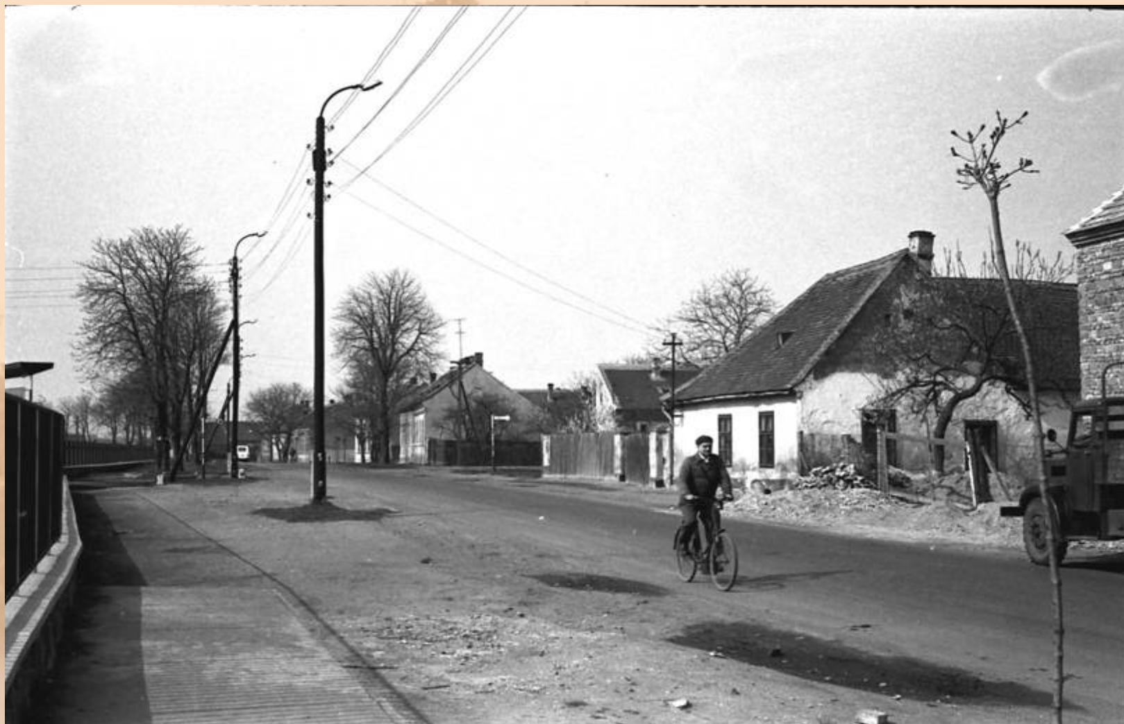
A Puskin (Rohonci) út 16. sz. épület, 1968. 04. 01.