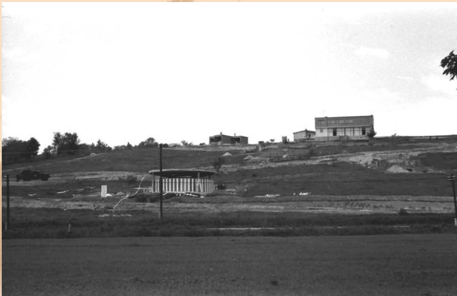
Az oladi domb, 1970. 05. 14.