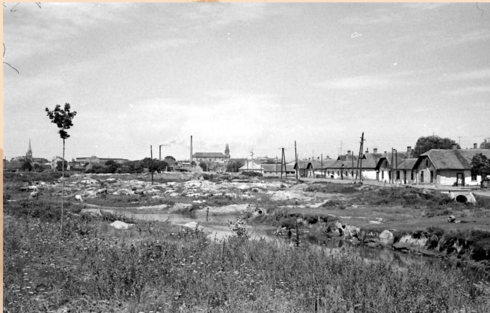
Az úgynevezett „Büntanya” a Sorok utca végén, jelenleg a Károly Róbert utca eleje, 1967. 08. 16.