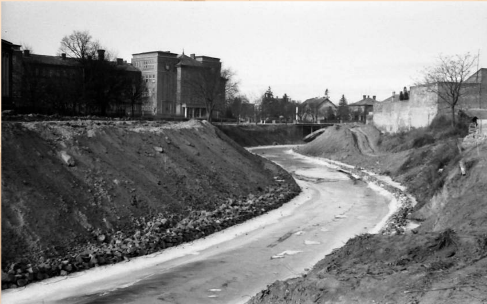
Az árvíz által megrongált Perint-patak partja a Nagykar utcánál, 1966. 01. 07.