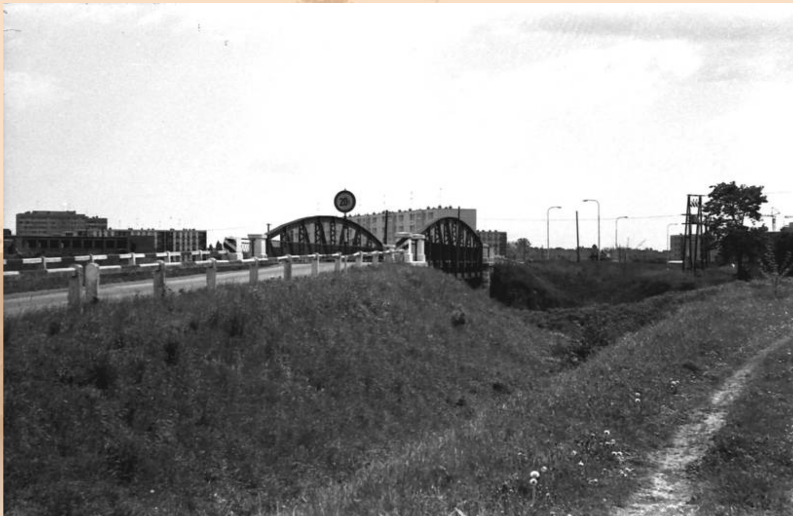
A Rohonci úti vashíd és a Derkovits-lakótelep, 1970. 05. 14.