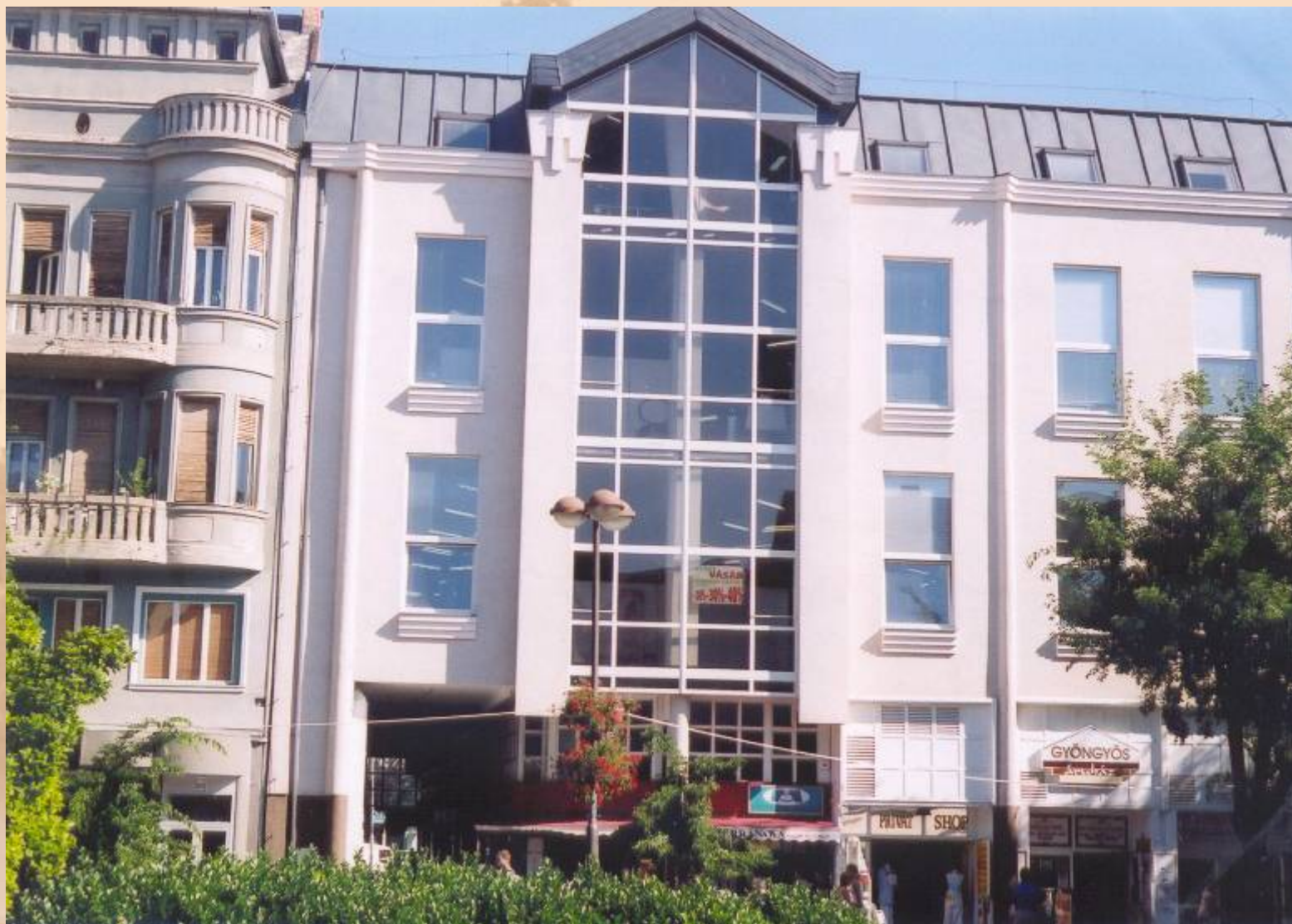
Gyöngyös Áruház, 2004. 08. 12.