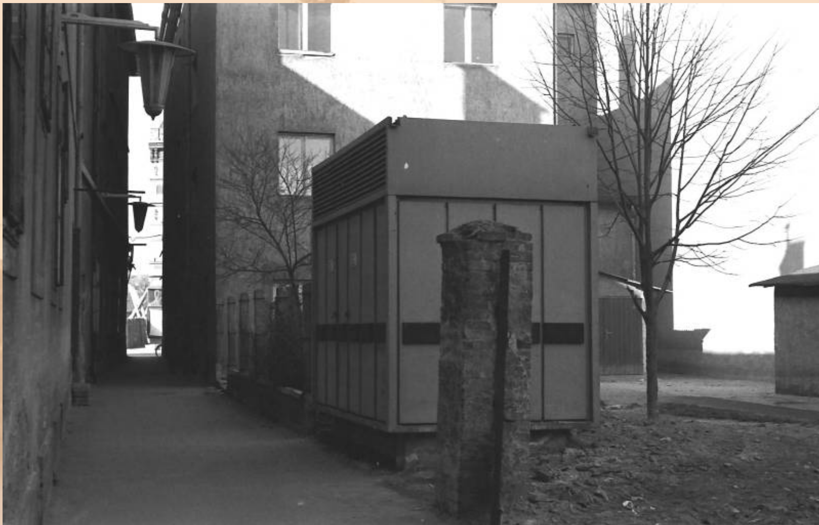
A Kisköz (Külsikátor), 1968. 02. 27.