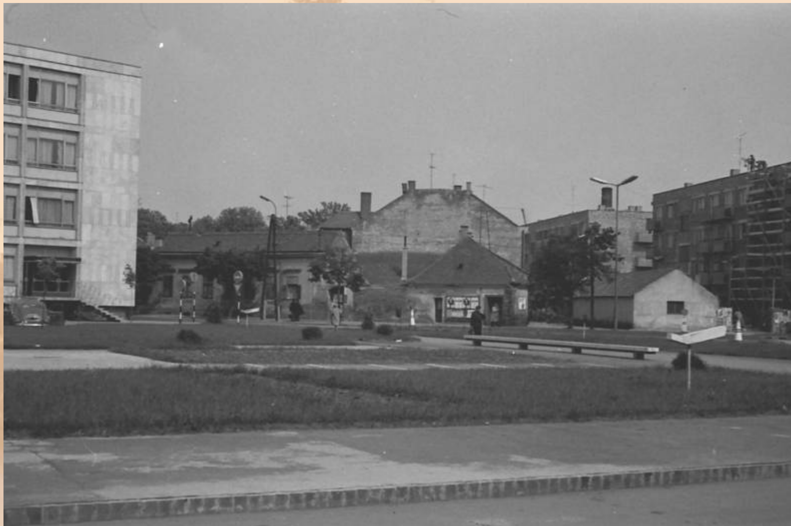
A 18-as Honvéd út házai, 1967. 05. 09.