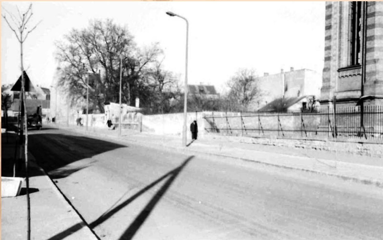
A Rákóczi Ferenc utca keleti oldala a Thököly Imre utcánál, 1966. 01. 07.