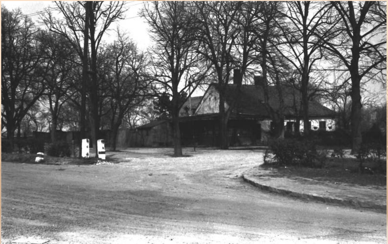
A Gagarin út 26. sz. ház, 1966. 03. 23.