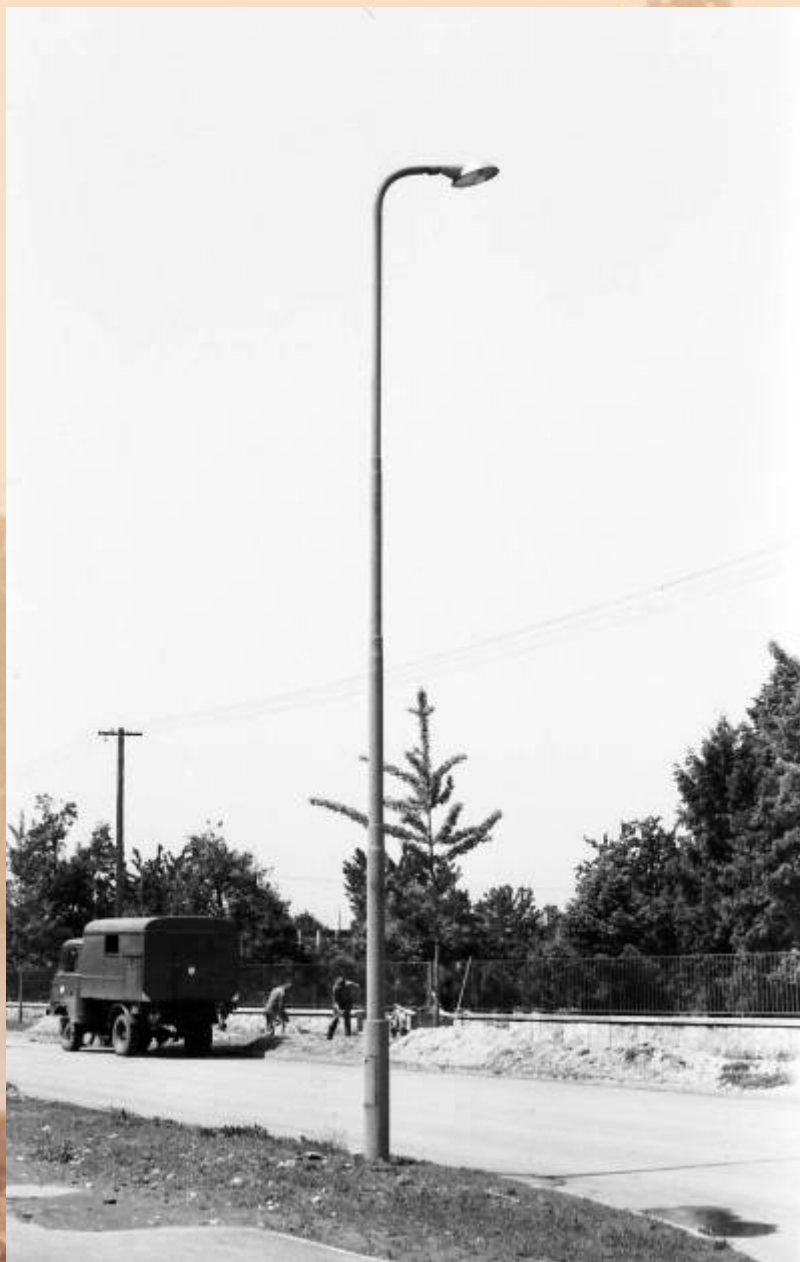
Közvilágítási oszlop a Dimitrov (Horváth Boldizsár) körúton, 1966. 06. 01.