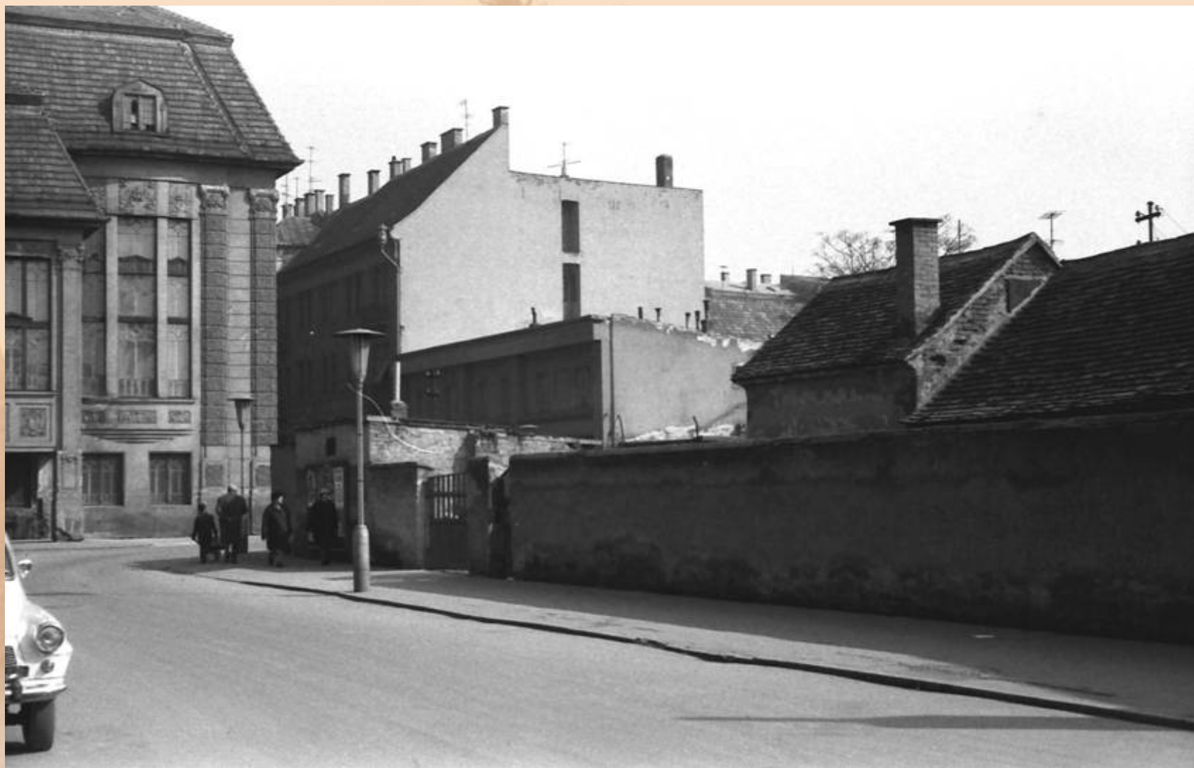
A Mártírok tere 3., 5. és 7. sz. házak, 1969. 03. 11.