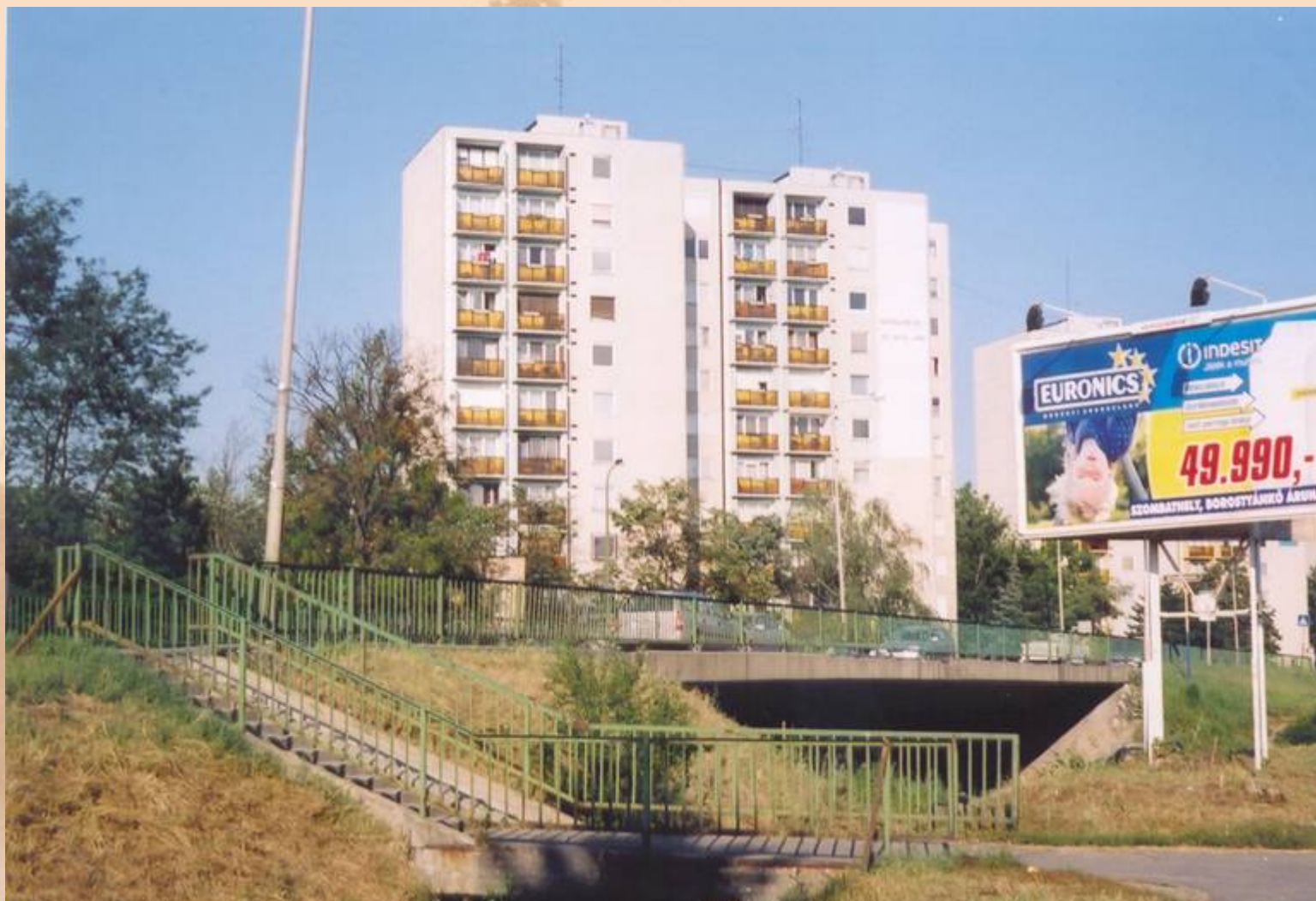
A Rohonci úti híd, 2004. 08. 09.