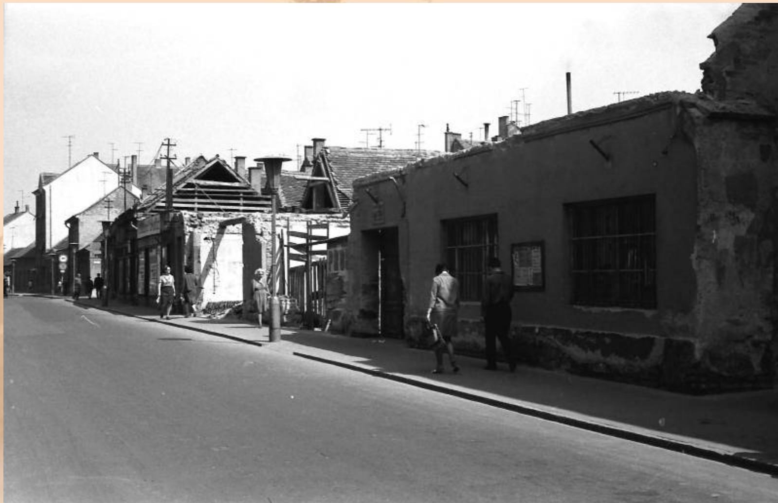
A Kőszegi utca 12-20. sz. házak, 1969. 05. 03.