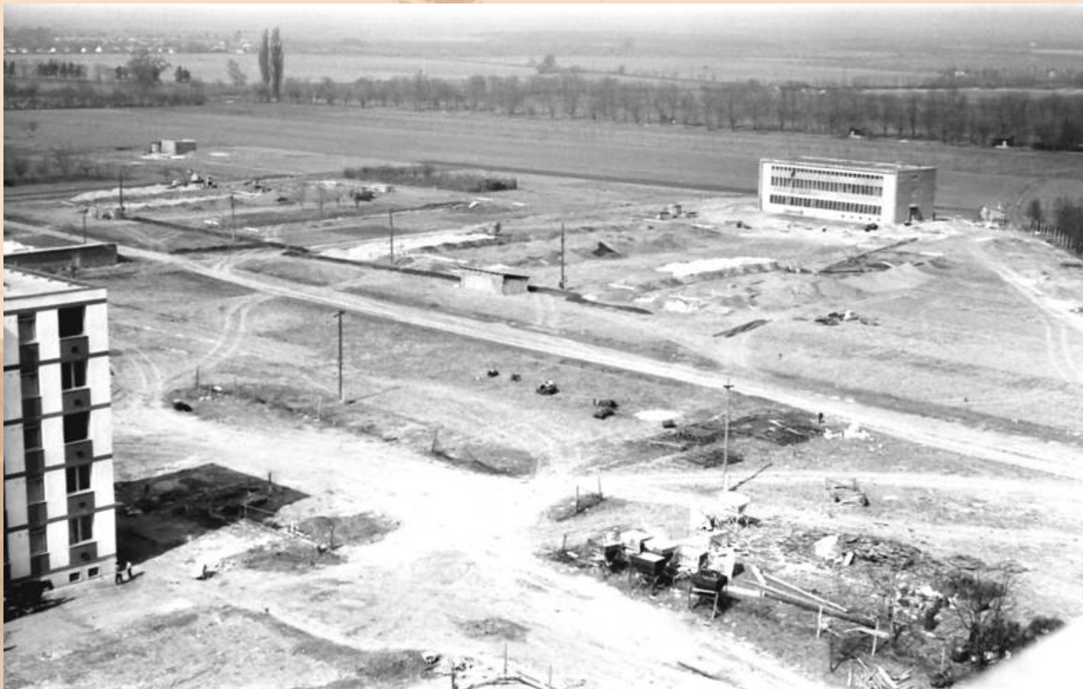
A Derkovits-lakótelep, 1966. 04. 07.