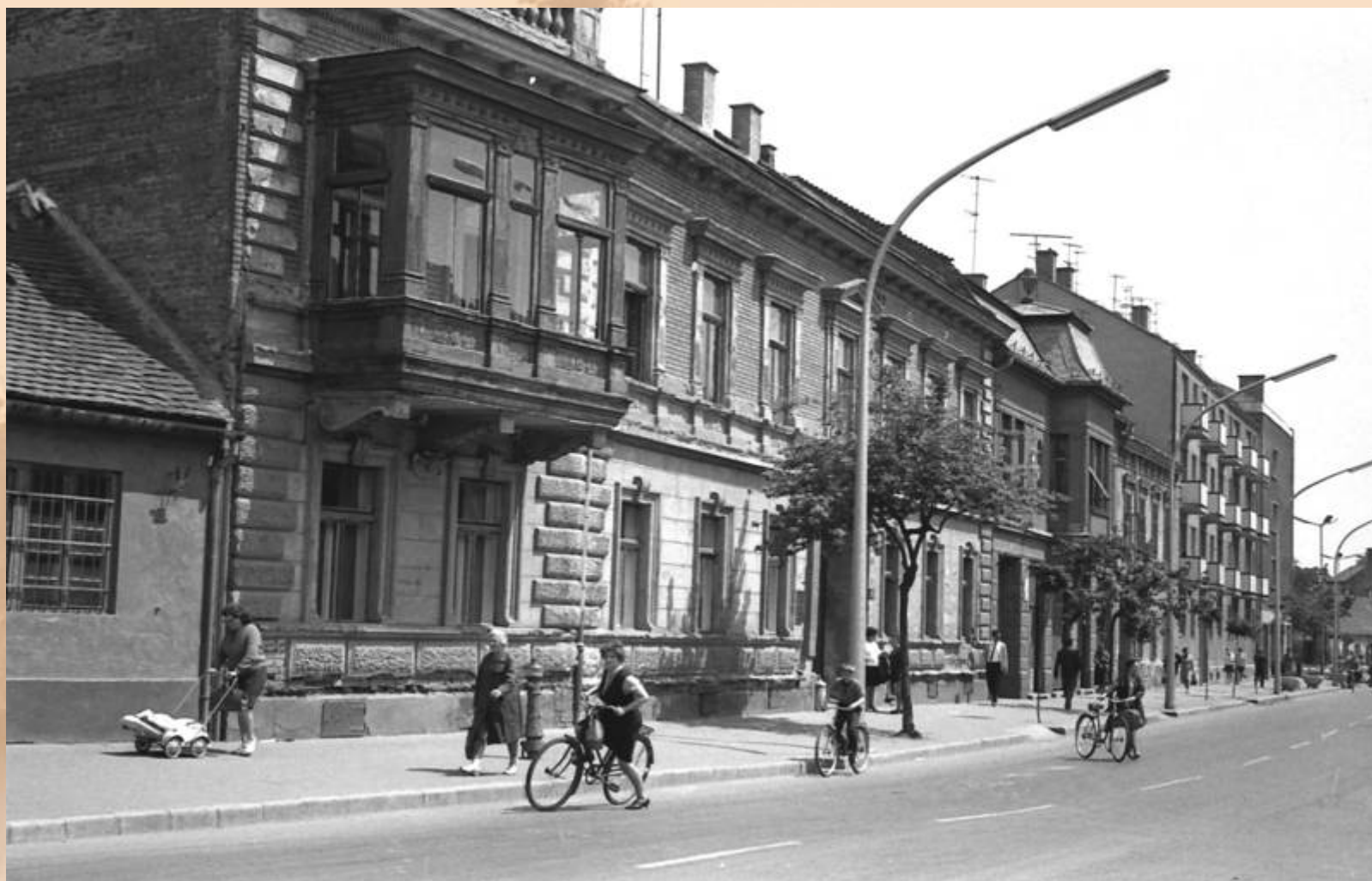
A Petőfi Sándor utca 43. és 45. sz. házak (Hübner-ház), 1967. 06. 16.