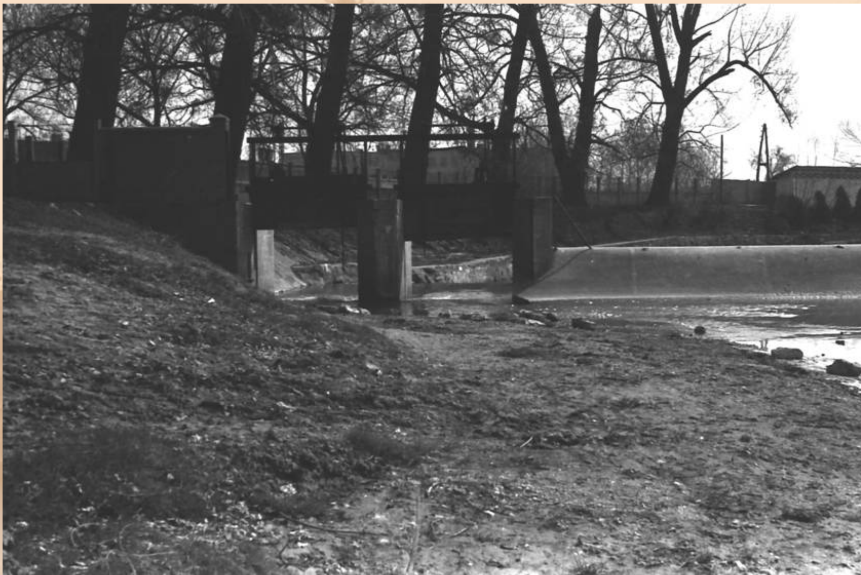
Duzzasztómű a Perint-patak régi strandjánál, 1966. 03. 23.