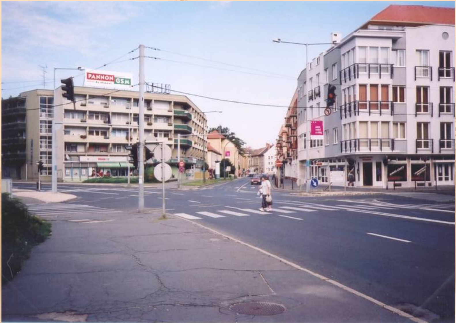
Szelestey utca, 2004. 09. 05.