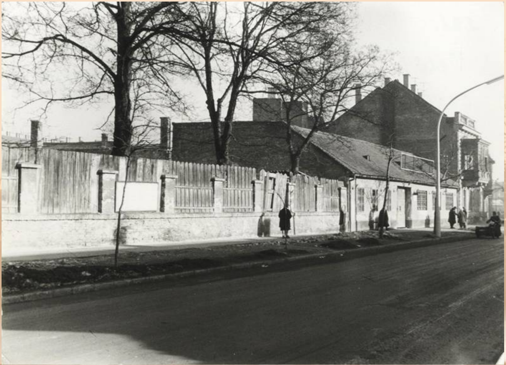
A Petőfi Sándor utca 41. sz. alatt volt a régi tűzoltólaktanya, 1967. 01. 18.