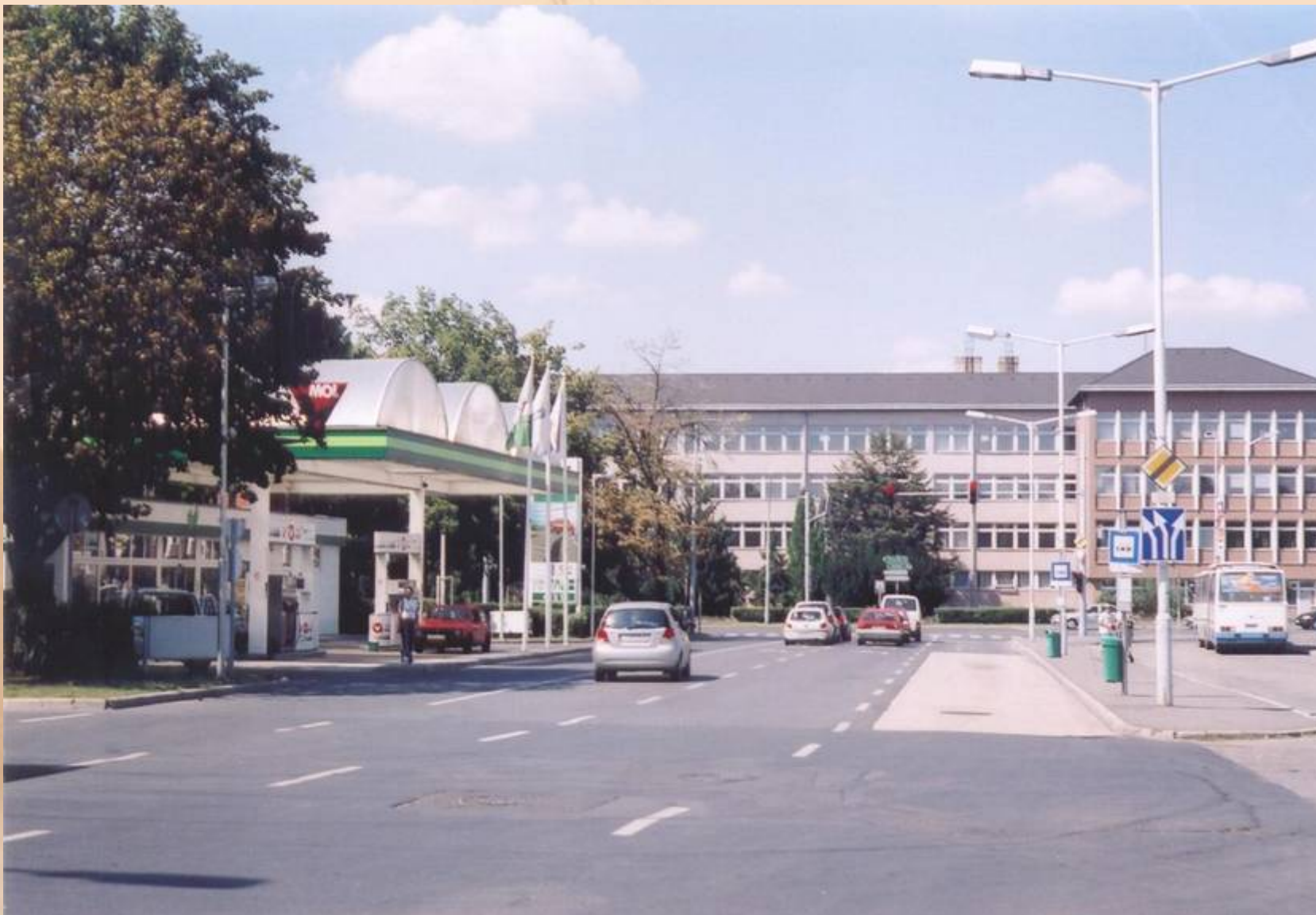
Iparitanuló Iskola, 2004. 08. 09.