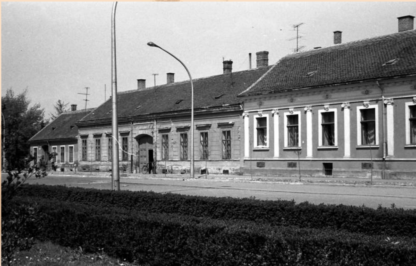
Az Ady Endre tér 5., 7. és 9. sz. házak, 1969. 05. 03.