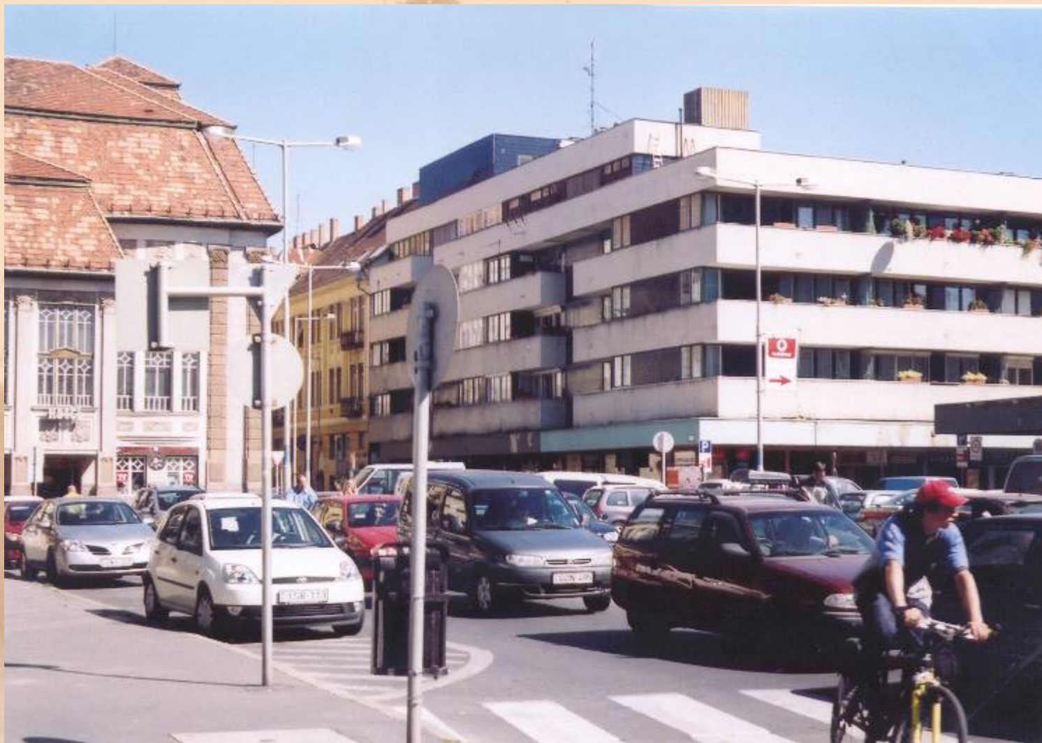
Mártírok tere, 2004. 09. 09.