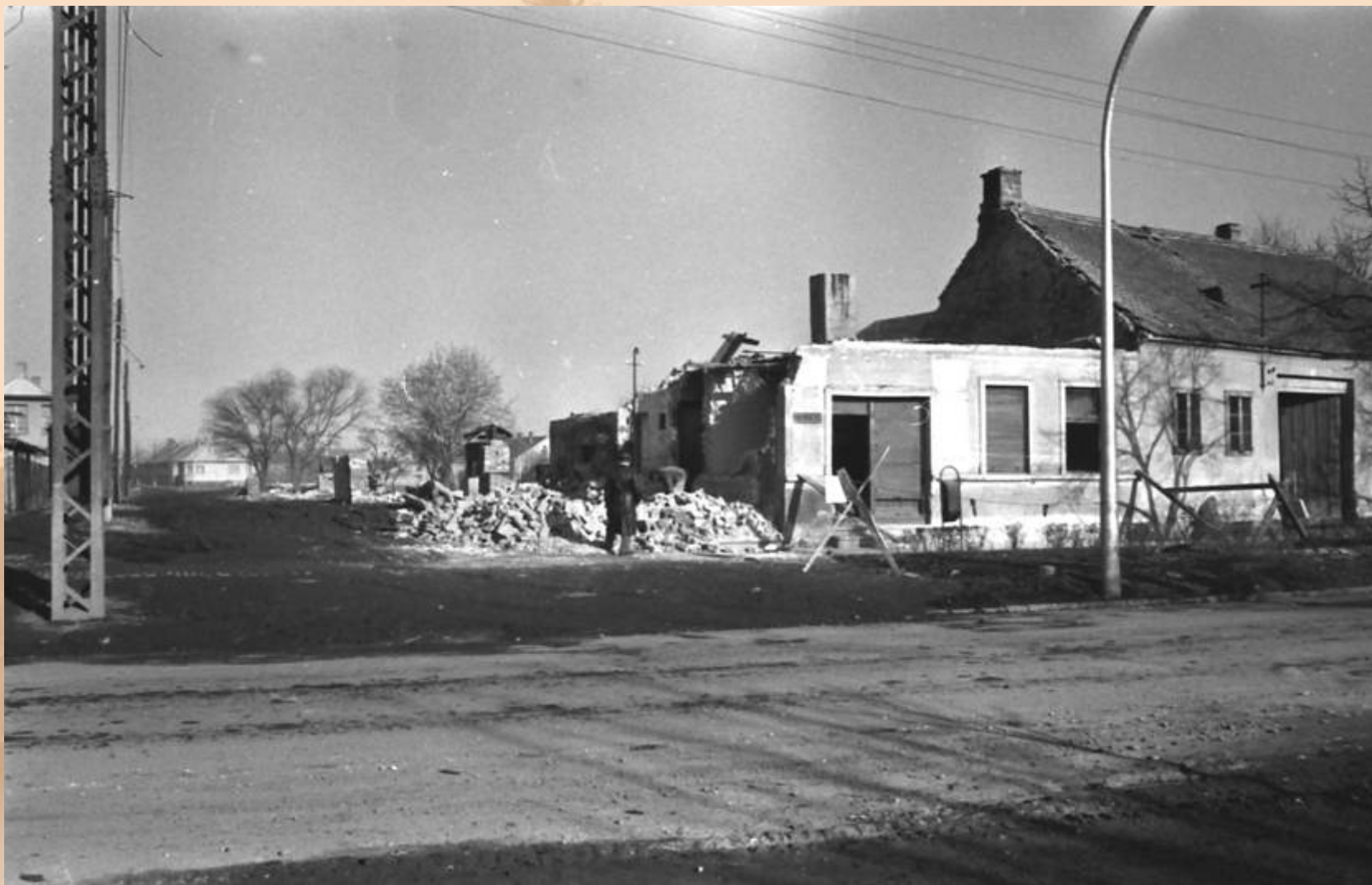
Az Ady Endre tér 13. és 15. sz. házak, 1967. 02. 07.