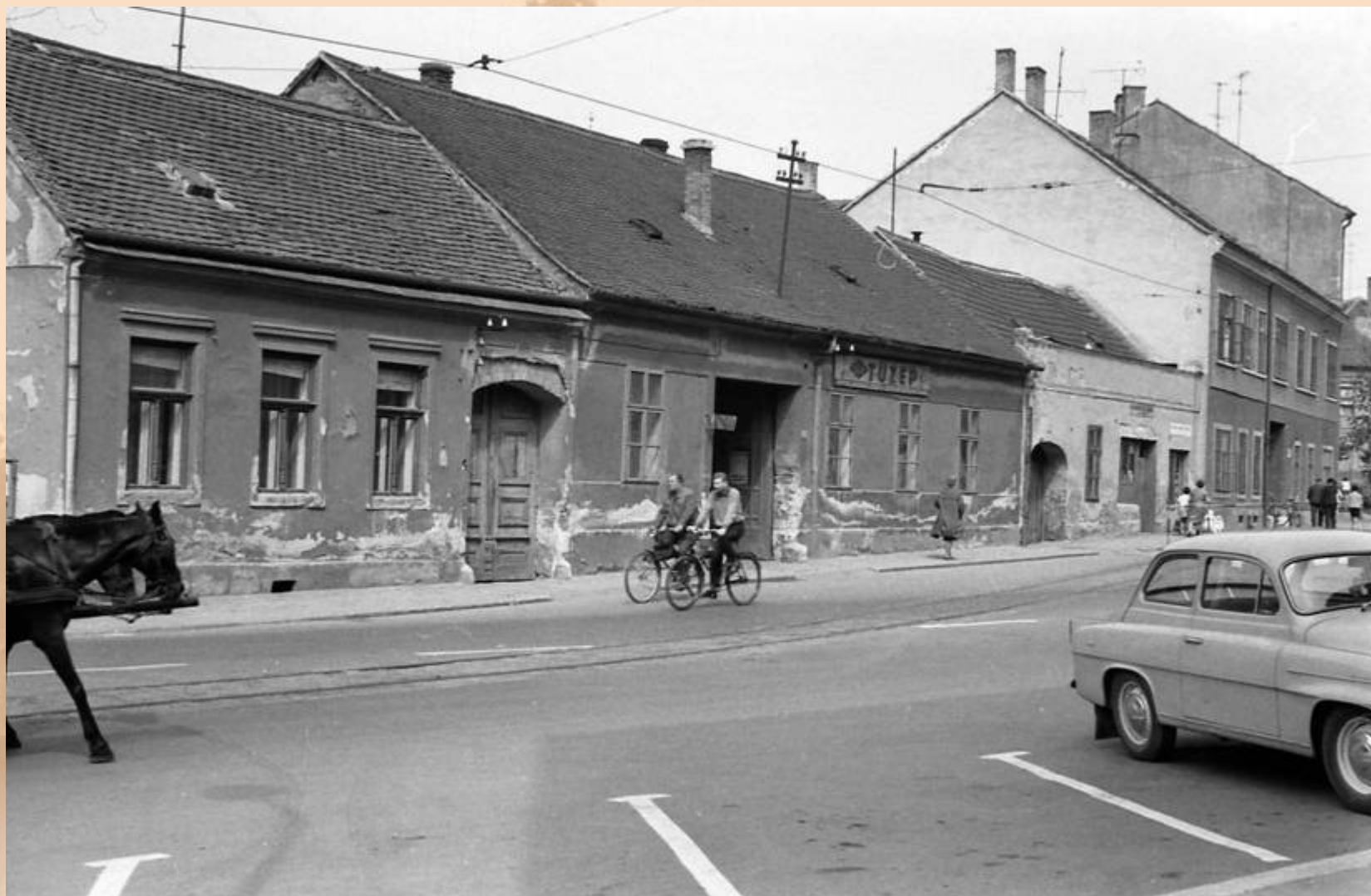
A Kiskar utca 4-10 .sz. házak, 1967. 06. 19.