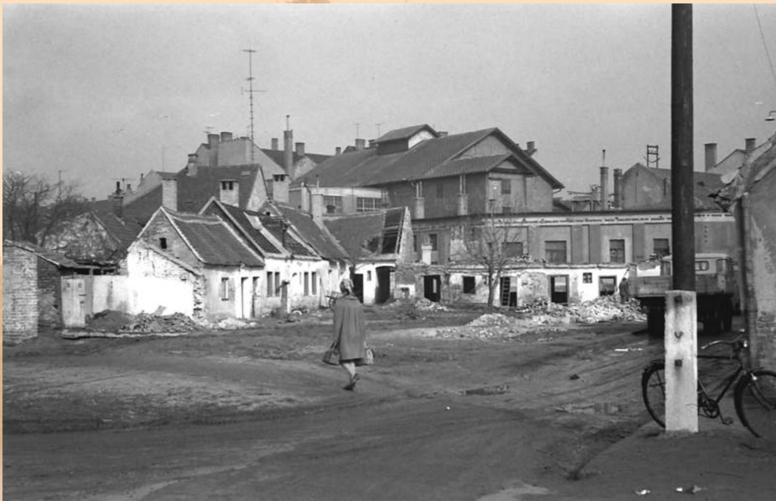
A Kiskar utca 18-28. sz. házak a Sorok utca felől, 1968. 02. 10.