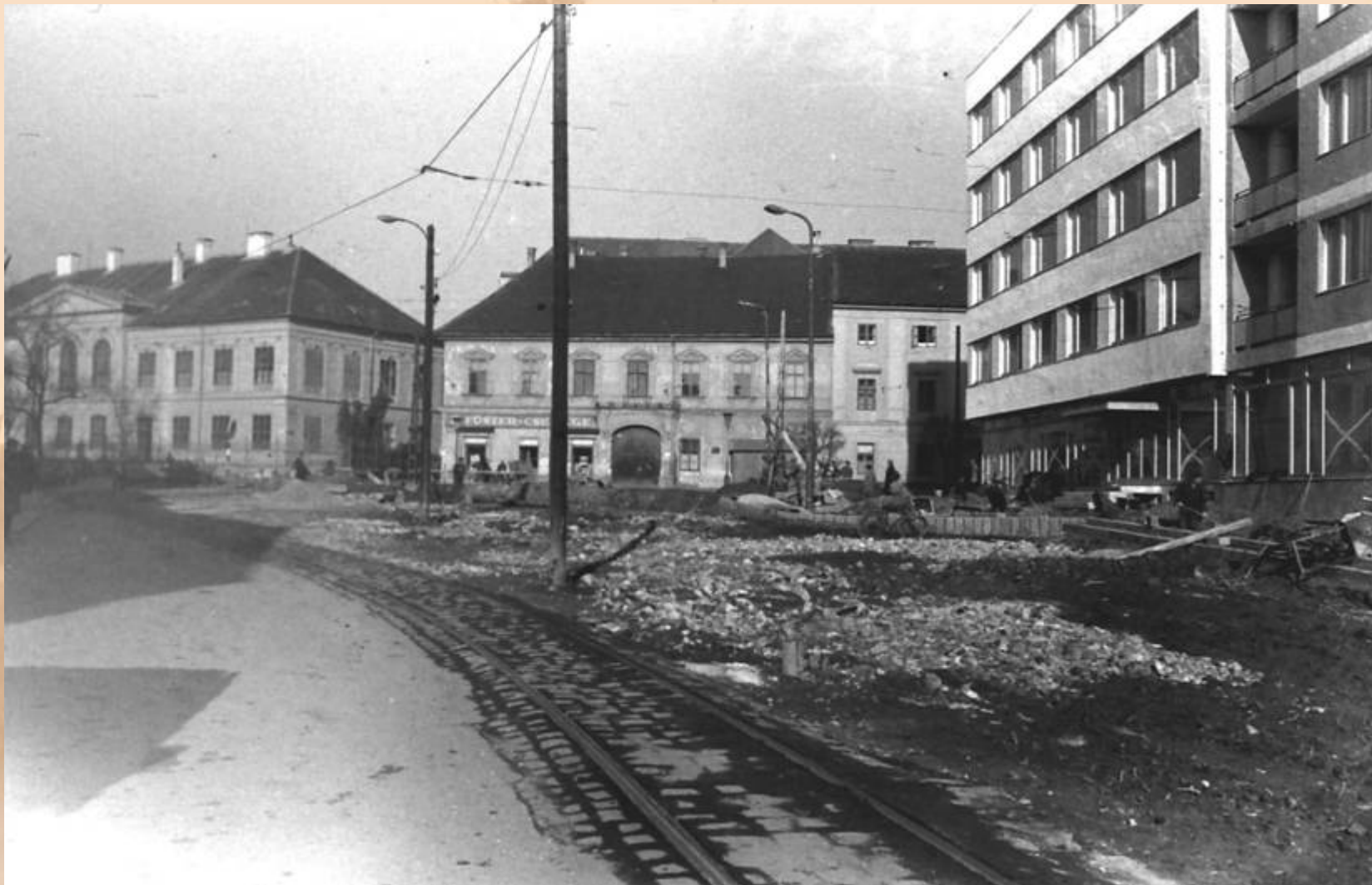
A Kiskar utca a Hollán Ernő utcánál, 1966. 11. 28.