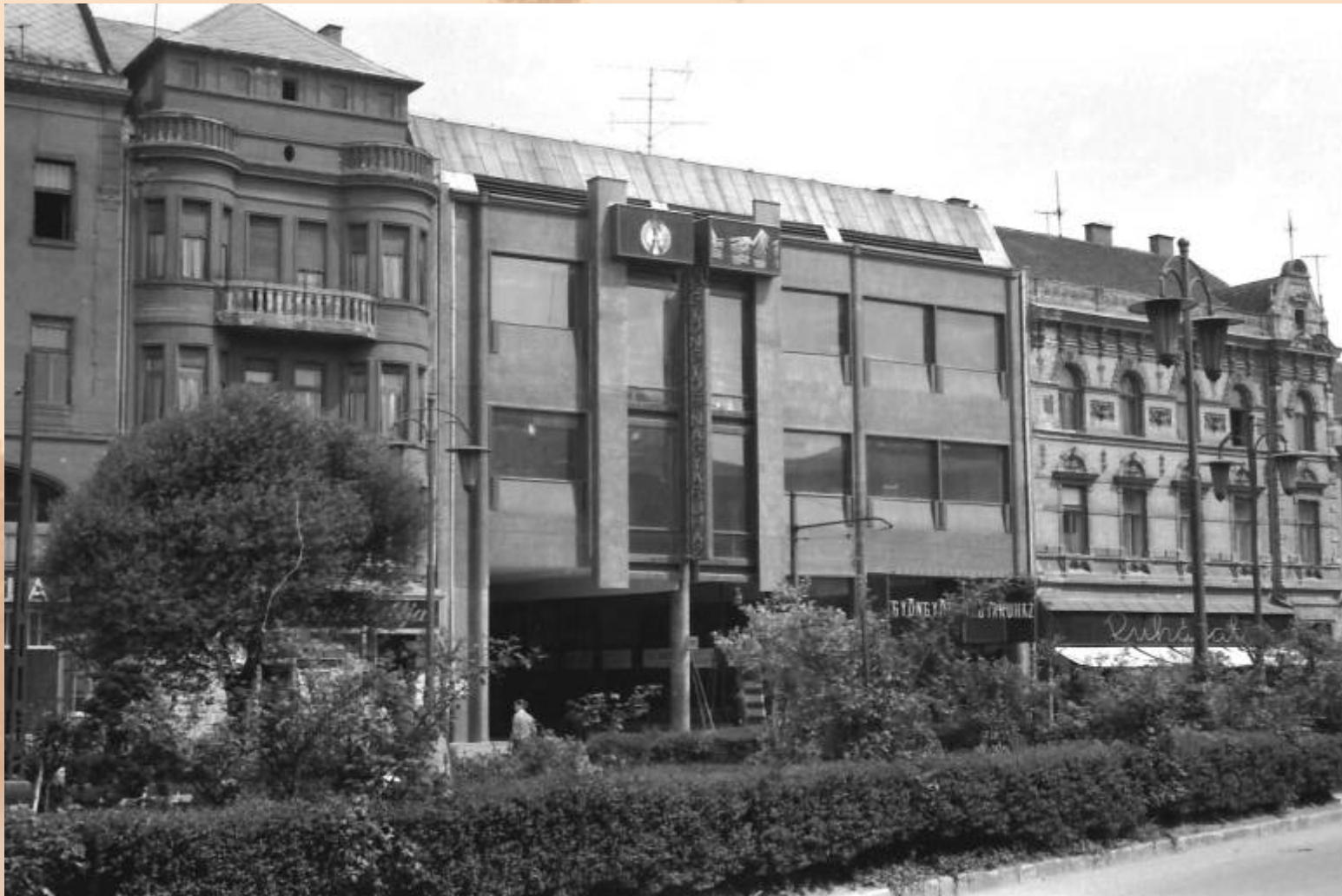
A Gyöngyös Áruház, 1970. 05. 14.