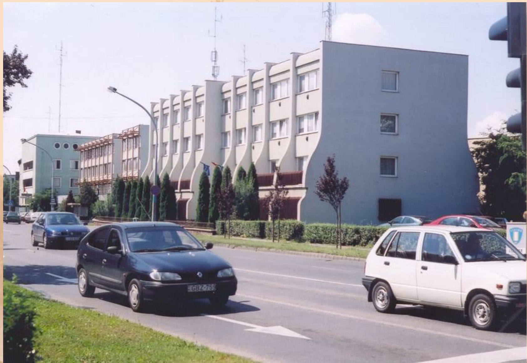
Ady Endre tér (Bíróság), 2004. 08. 09.