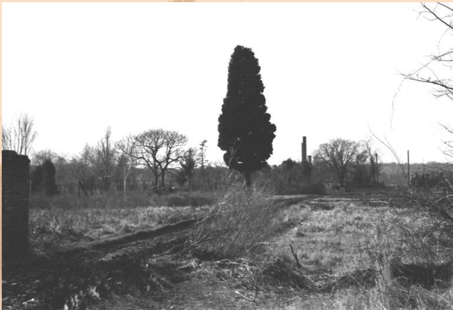
A Kertészeti Vállalat a Kondics (Kenderesi) utca felől, 1966. 02. 16.