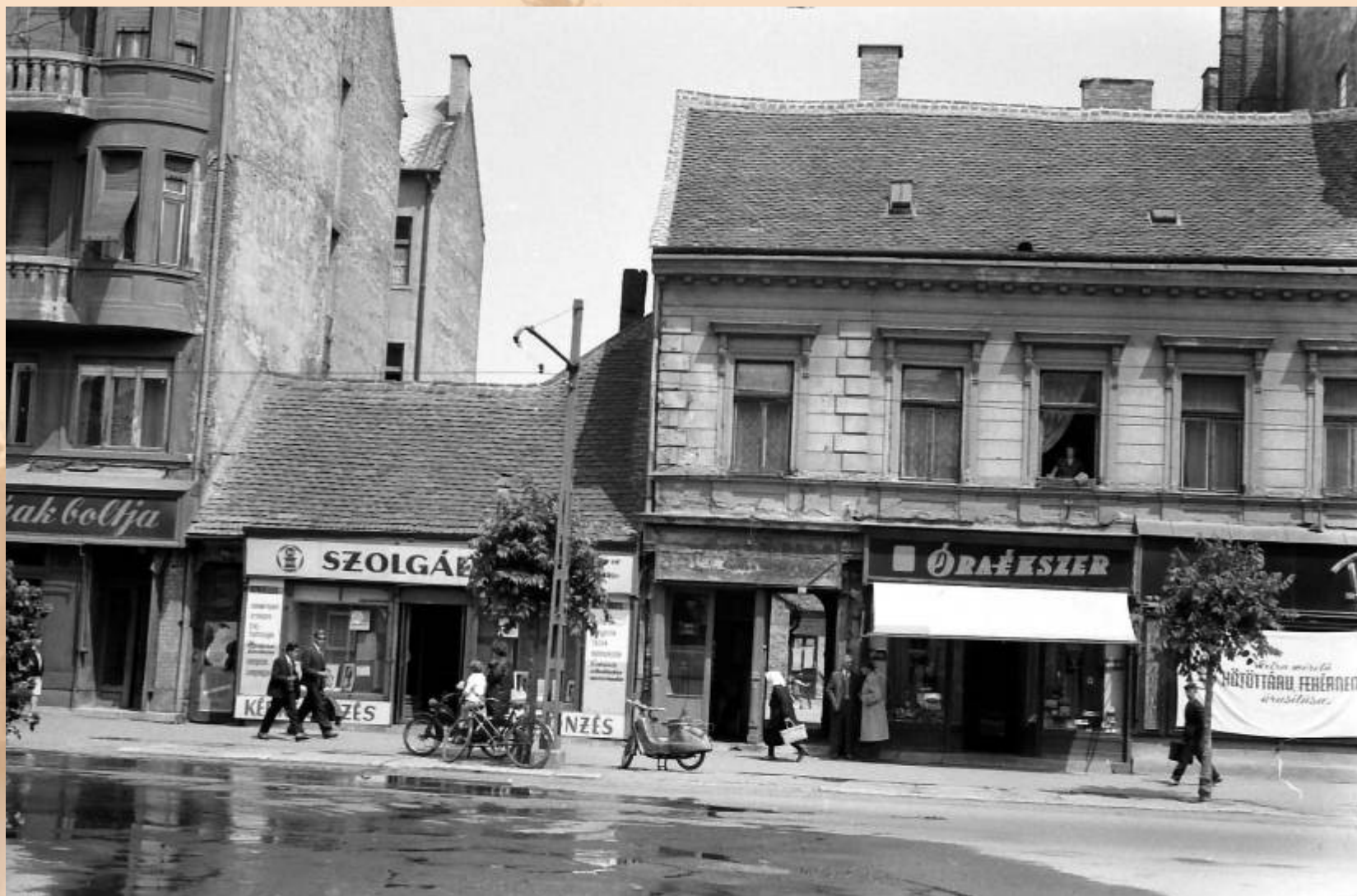
A Köztársaság (Fő) tér 21. és 22. sz. házak, 1967. 06. 16.