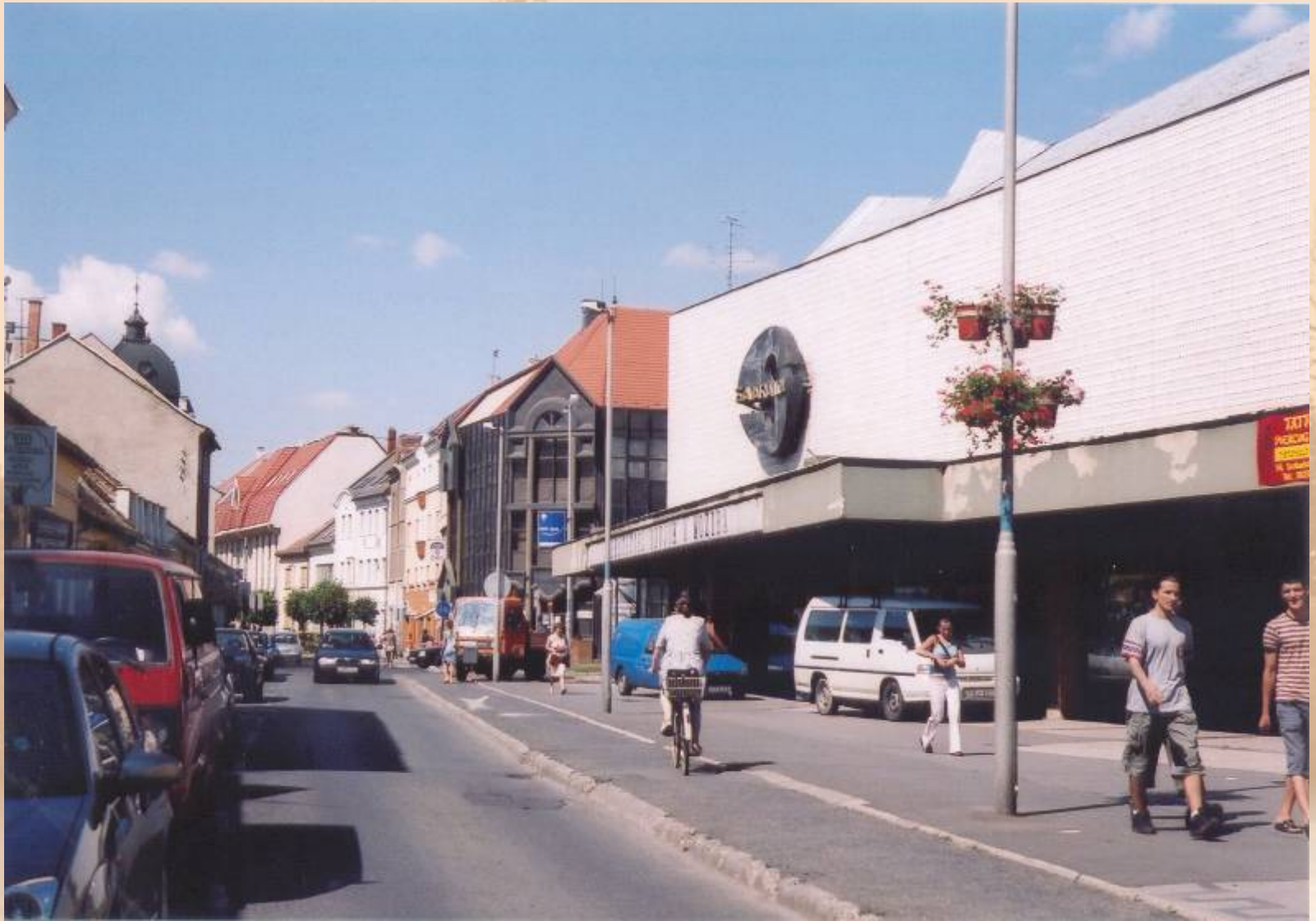
Kőszegi utca (Mozi), 2004. 08. 09.