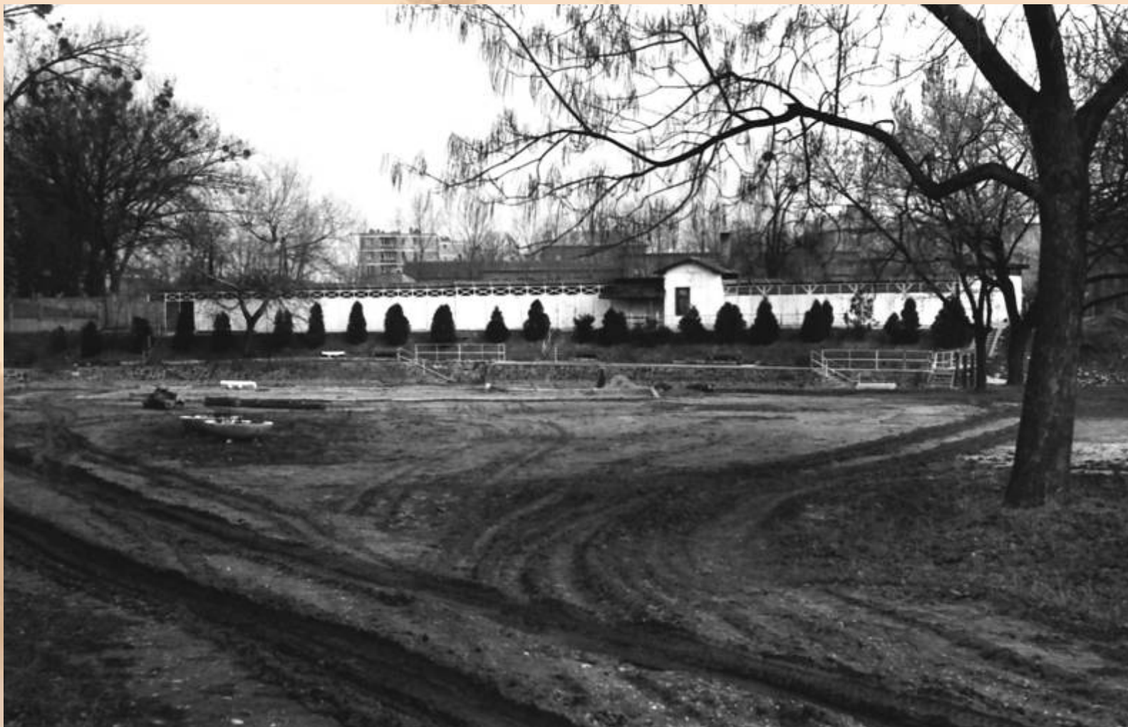
A régi strandként ismert fürdőhely és kabinsora a Perint-patakon, a Kondics (Kenderesi) utcában, 1966. 02. 16.