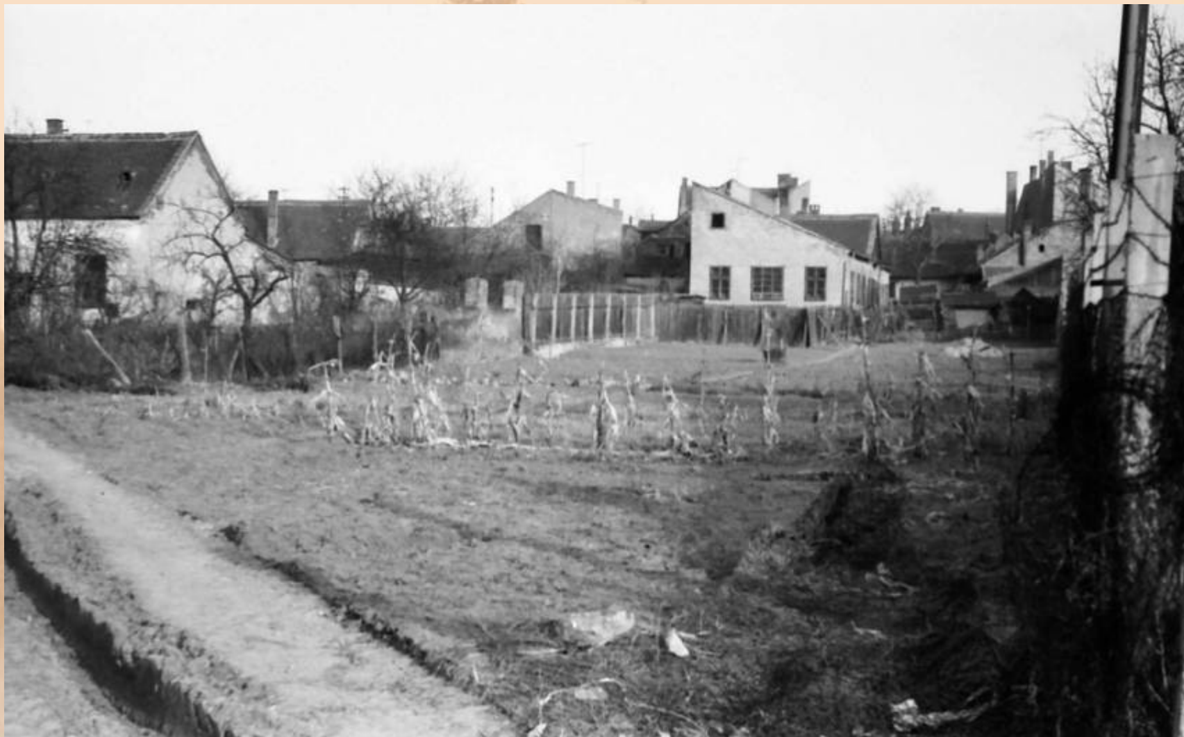
A Nagykar utca 3. sz. ház a Perint-patak felől, 1966. 01. 07.