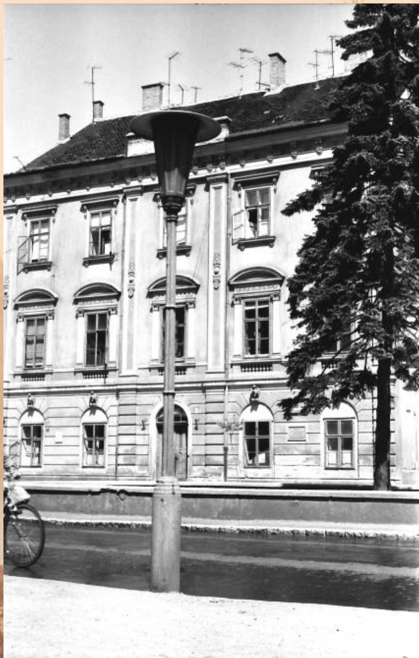
Közvilágítási oszlop az Alkotmány (Szily János) utcában, 1966. 04. 01.