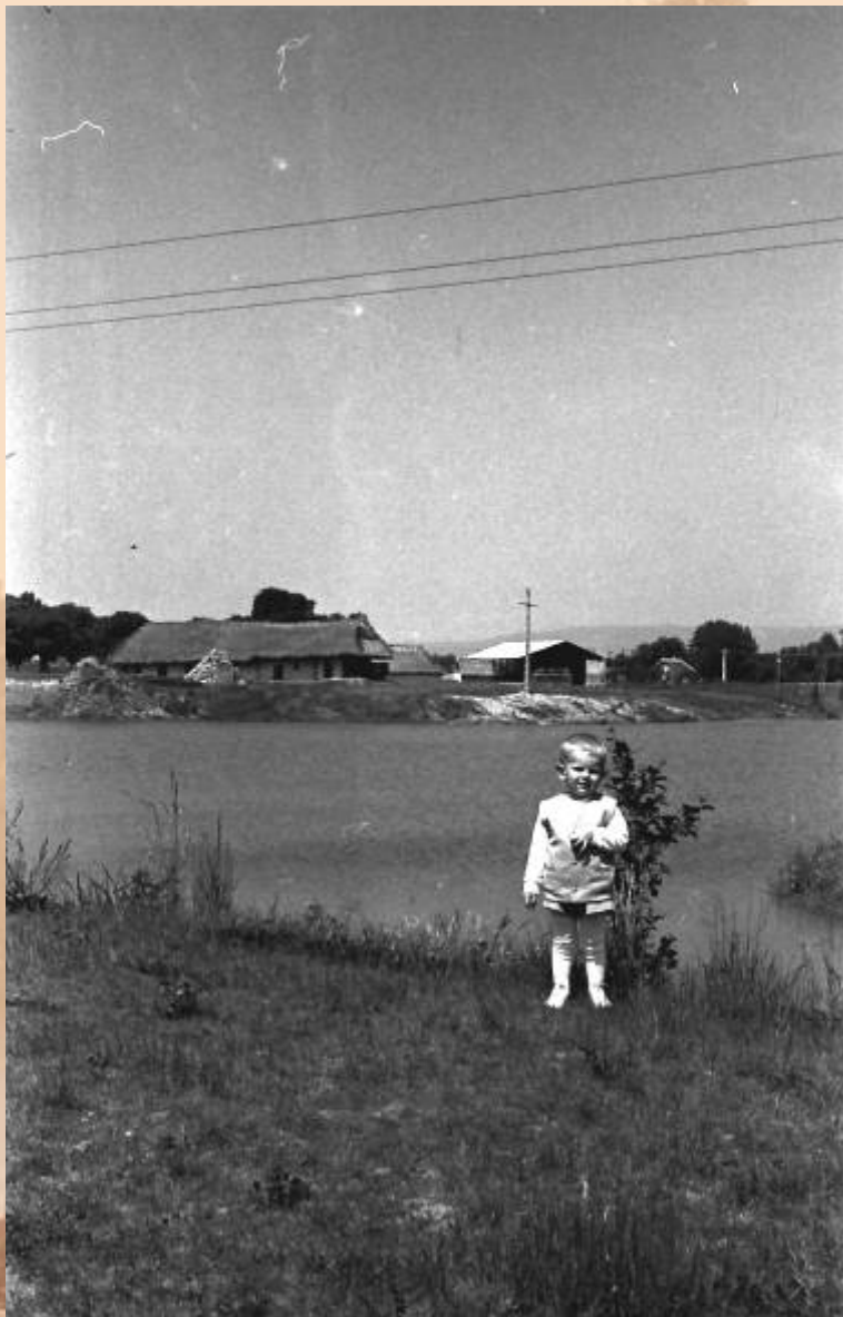
A Múzeumfalu, 1969. 05. 15.