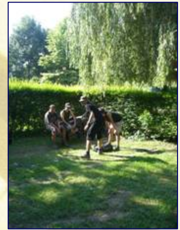
Balf, Castrum Camping