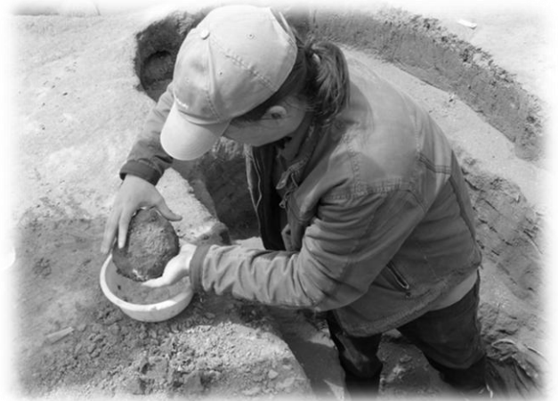
A pajzsdudor kiemelése a „farkasos harcos” sírjából