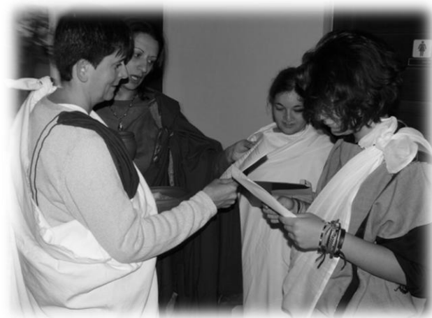
Papnők a próbán