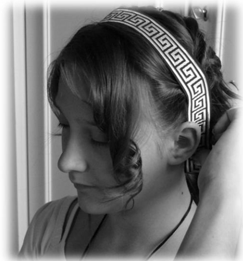
A nap lánya