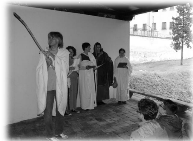
Savaria angurja jelet kér az isteneketől (és kap is égi áldást – többet a kellelénél)